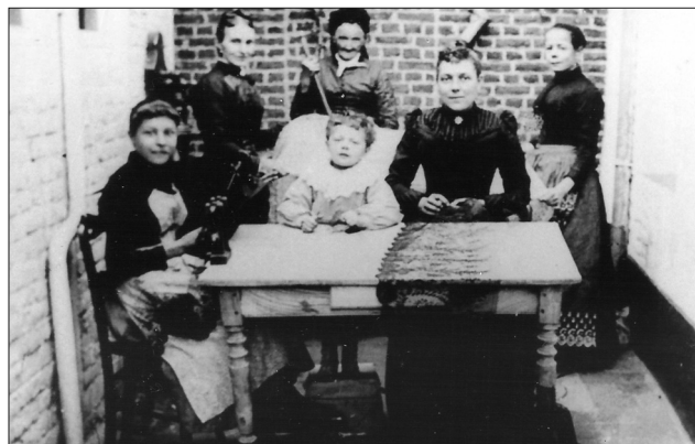
Raccommodeuses à domicile de dentelle Chantilly - Rue de Valenciennes, Impasse Nieuw 1890